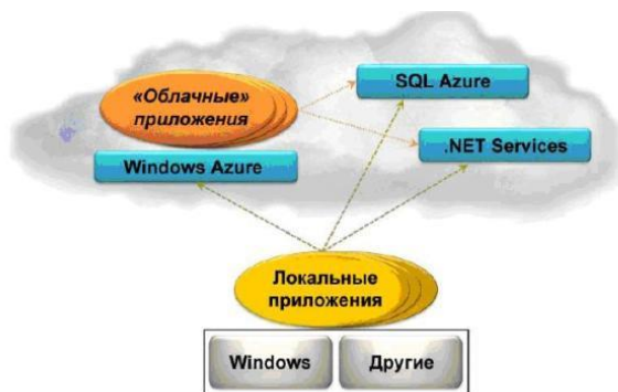
Рисунок 2 - Платформа Windows Azure поддерживает приложения, данные и инфраструктуру, находящиеся в "облаке"

Каждый компонент платформы Windows Azure играет собственную роль.